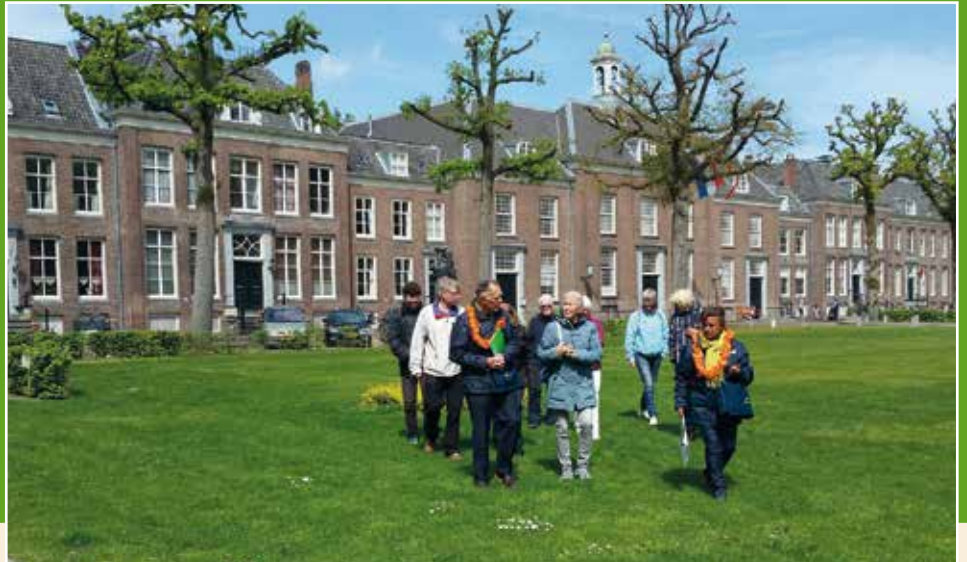
De projectgroep Rondleidingen vult een deel van het middagprogramma in met een speciale rondleiding over de pleinen. Deze foto is gemaakt bij oranjerondleiding 2019, op het Zusterplein.